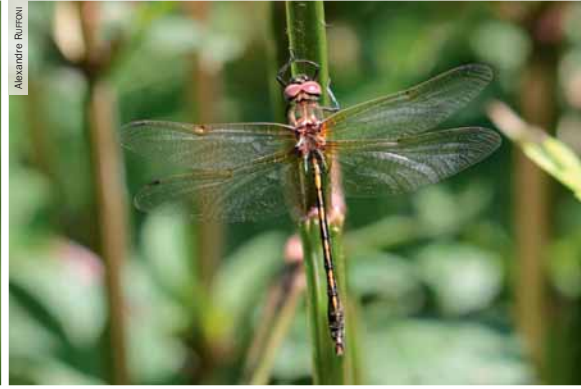
La Cordulie à corps fin Oxygastra curtisii .

Si certaines espèces de la déclinaison régionale du Plan national d'actions en faveur des libellules sont largement réparties, on constate que certaines zones concentrent le maximum d'enjeux (carte 1). C'est le cas des massifs du Jura, des Vosges et dans une moindre mesure du Morvan, ainsi que des principaux grands bassins versants de la région (Loire, Saône et Yonne). D'autres hotspots apparaissent çà et là en raison d'une concentration d'étangs de très bonne qualité.