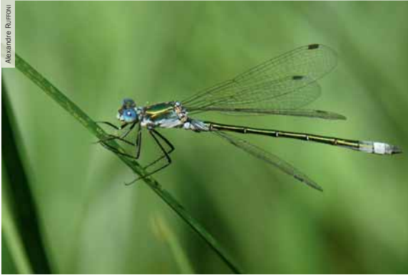
Le Leste des bois Lestes dryas , mâle adulte.