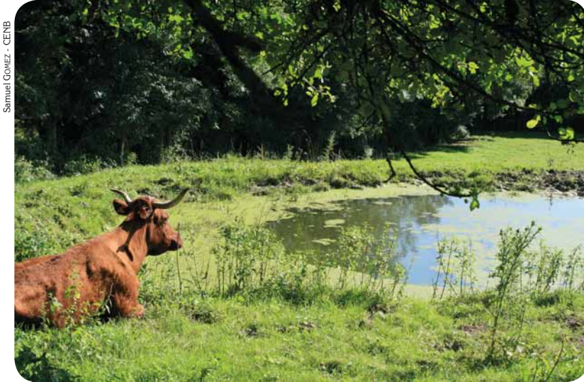
Mare agricole en Puisaye.

* Conservatoire d'espaces naturels de Bourgogne Chemin du Moulin des étangs- 21600 FENAY Mél : reseauxmares@cen-bourgogne.fr