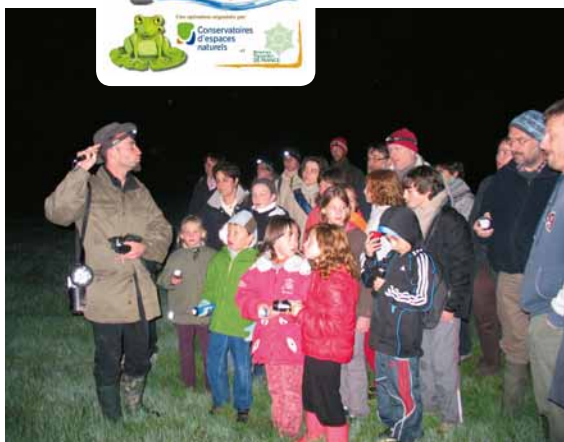
Animation Fréquence Grenouille en Côte-d'Or.