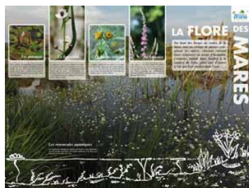
Une série de trois posters sur la flore, la faune et les rôles des mares (disponibles sur demande au Conservatoire).