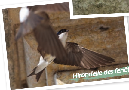
Hirondelle des fenêtres