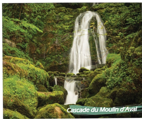
Cascade du Moulin d'Aval

« Saut du Chien » (point de vue sur la cluse du Flumen), cascade du Moulin d'Aval, gorges du Flumen, belvédère de la Roche Blanche.